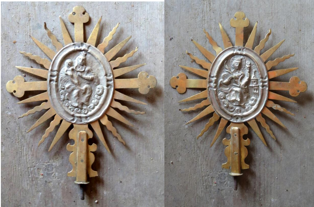
Bekrönung der Bruderschaftsfahne, Messing ausgeschnitten, mit betriebenen Medaillons der Muttergottes und der hl. Barbara belegt.