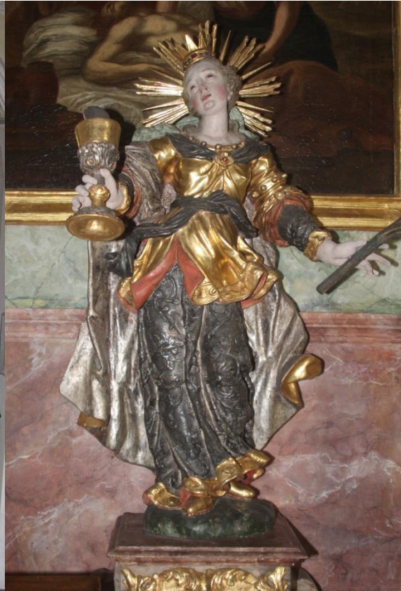
Hl. Barbara, barock, ehem. Prozessionsfigur der Bruderschaft