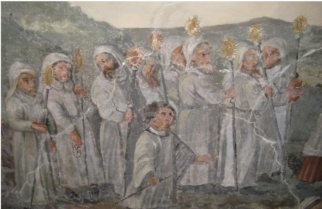
Prozession einer Bruderschaft in Kutten und mit Stäben - Fresko in Grassau, Chiemgau