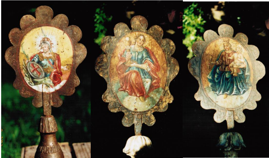
Bruderschaftsstäbe mit Emblemen des hl. Georg, der hl. Barbara, der Muttergottes, des hl. Pantaleon und der hl. Katharina