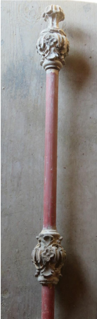
Bruderschaftsstab, ohne Emblem