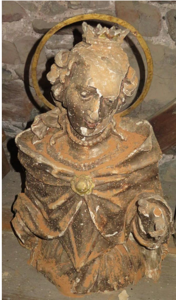
Altarbüste, vermutlich hl. Barbara, Rokoko