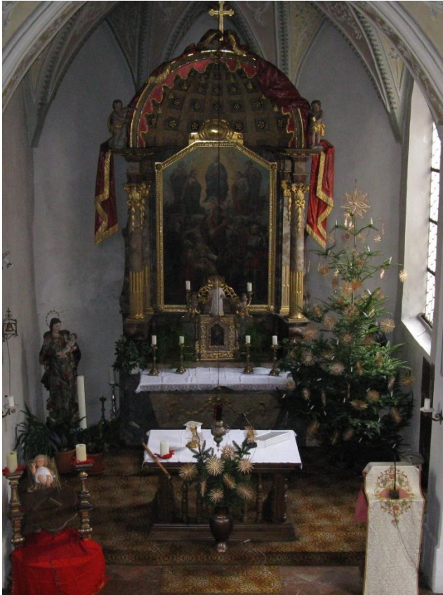
Ehem. Bruderschaftsalter von Amerang, jetzt Hochaltar von St. Aegidius in Wasserburg Die Kirche besaß bis 1811 einen Seitenaltar, der den Nothelfern geweiht war, sowie ein Fresko am Turm.